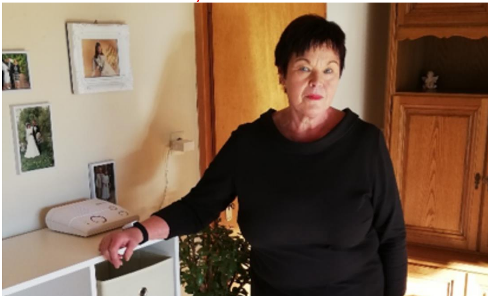
BRK KV Kronach Eine Digitalisierungstesterin aus dem Raum Kronach

Welche Ziele möchte dieses Projekt erreichen?