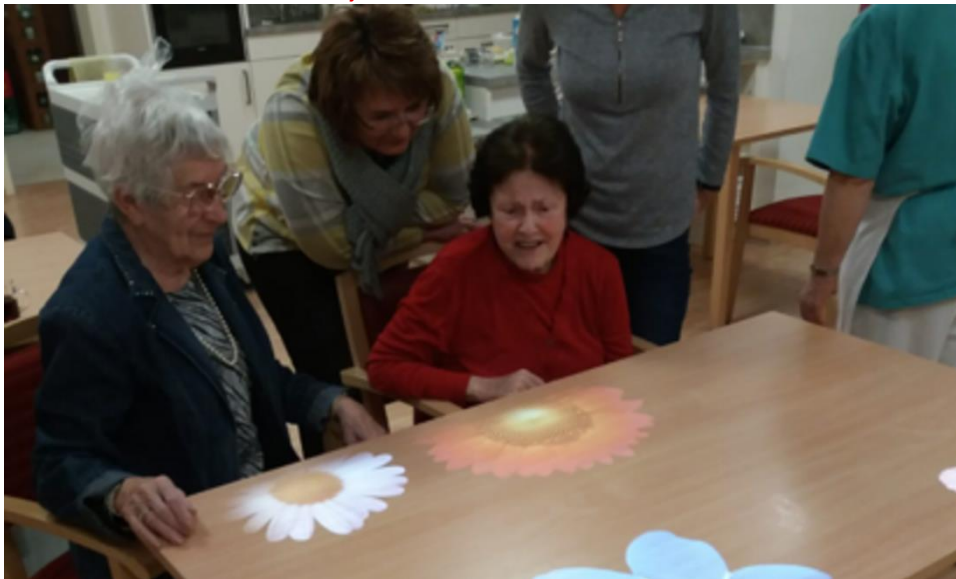
BRK KV Kronach

Einsatz der Tovertafel im BRK Seniorenhaus Kronach