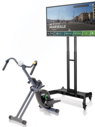
Das Active Bike des Bike-Labs

Nicht inbegriffen in dem Paket ist ein Bewegungs- oder Hometrainer. Jedoch bietet das Bike-Labyrinth durch das sogenannte Active Bike (siehe Foto) eine Alternative zum Hometrainer, welche auch vom Kreisverband Köthen genutzt wurde. Beim Active-Bike handelt es sich um ein "fahrradähnliches Gestell", so Ines Streuber, bestehend aus Pedalen mit Klettverschlüssen zur besseren Fixierung sowie einem Lenker mit Knöpfen zur Navigation.