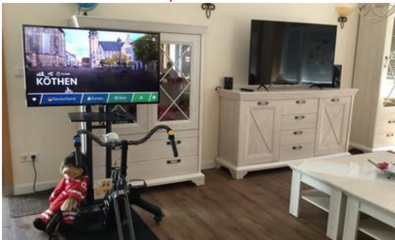
Ines Streuber/ DRK Köthen e.V.

Das Bike-Labyrinth im DRK Kreisverband Köthen