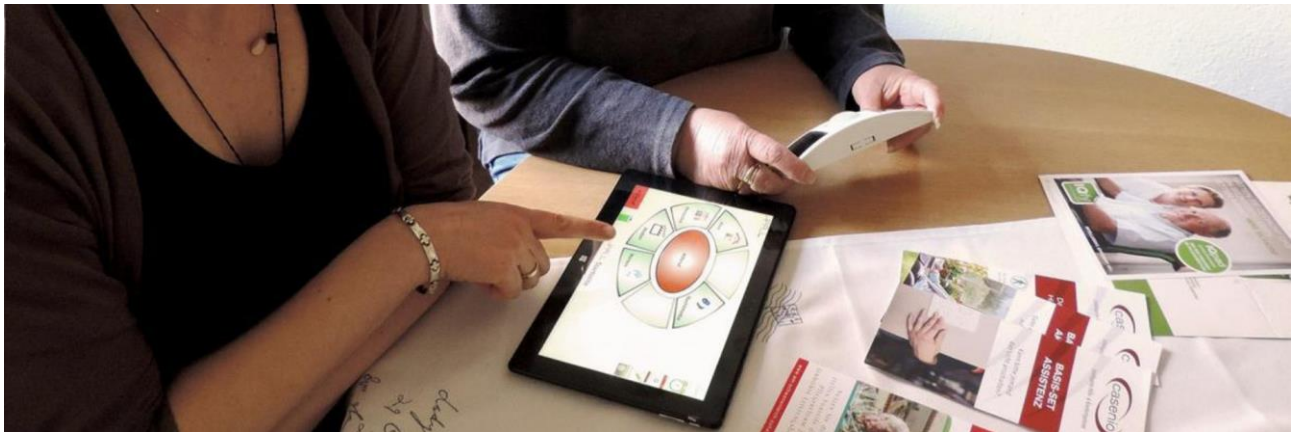
DRK KV Stendal