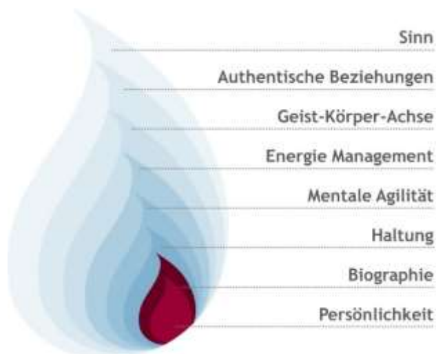
Abbildung 2: Das FiRE-Modell der Resilienz (K. Drath, Die Kunst der Selbstführung, Haufe, 2019)

Für unsere Arbeit mit Führungskräften haben wir die verschiedenen Faktoren effektiver Selbstführung zum „FiRE-Modell“ mit seinen acht verschiedenen Sphären zusammengefasst. Die Abkürzung steht dabei für „Factors improving Resilience Effectiveness“. Das Modell dient dazu, alle bekannten und wissenschaftlich belegten Strategien zum Erhalt bzw. der Verbesserung der eigenen Resilienz strukturiert und mit einer ganzheitlichen Sichtweise zusammenzufassen. Entwickelt wurde das