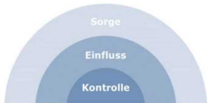
Abbildung 4: Das Modell "Circle of Control" (K. Drath, Resilienz in der Unternehmensführung, Haufe, 2016)