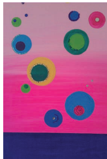
Das Bild gehört zum Projekt „Kunst trotz Demenz“ des Wohn- und Pflegeheims „Am Staffelberg“.

Das, was ich dort tue und erlebe, kann ich nur jedem weiterempfehlen. Das sind alles super Erfahrungen.