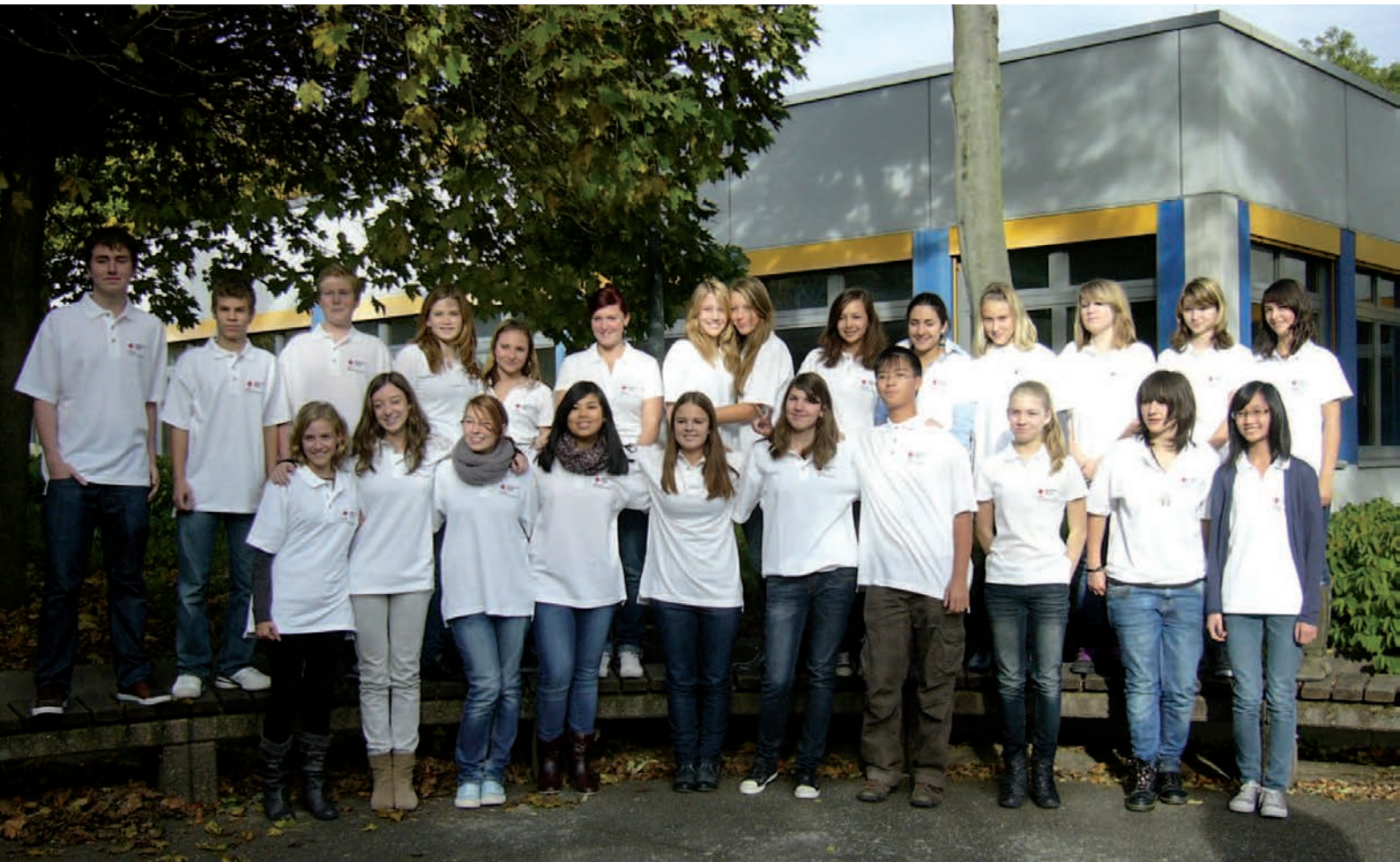
Engagierte Jugendliche des Konfliktmanager-Projektes „Rückenwind“ des DRK-KV Kehl e.V.