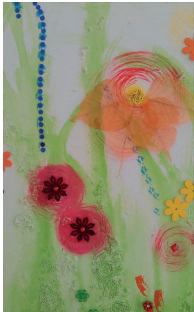
Projekt „Kunst trotz Demenz“

Ich möchte den Menschen, die ich besuche, etwas Vertrauen und Stärke mit auf ihren schwierigen verbleibenden Lebensweg geben. Hierbei sind mir auch die Angehörigen sehr wichtig. Ich versuche, sie bei ihrer schweren Aufgabe zu unterstützen, ihnen Mut zum Durchhalten zu machen und ihnen dabei auch zu helfen.