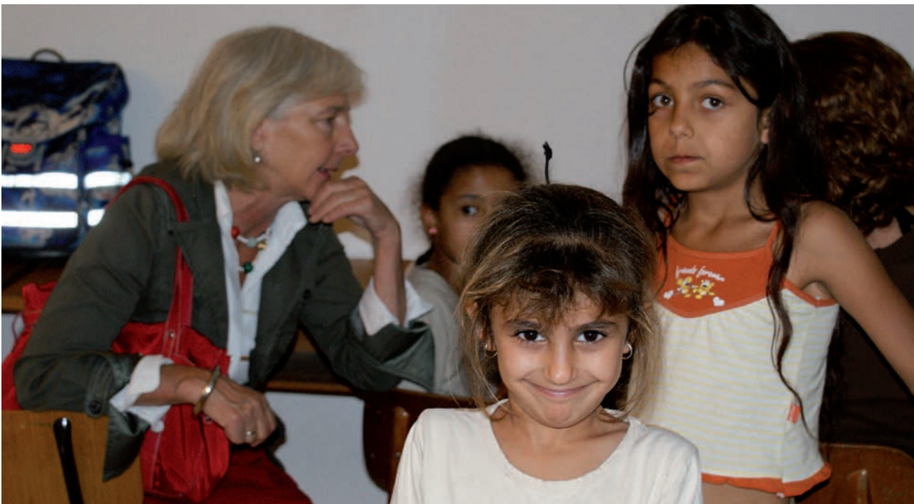
DRK-Vizepräsidentin Frau von Schenck während ihres Besuchs eines Flüchtlingsprojektes für junge Roma aus dem Kosovo, DRK-KV Freiburg e.V.