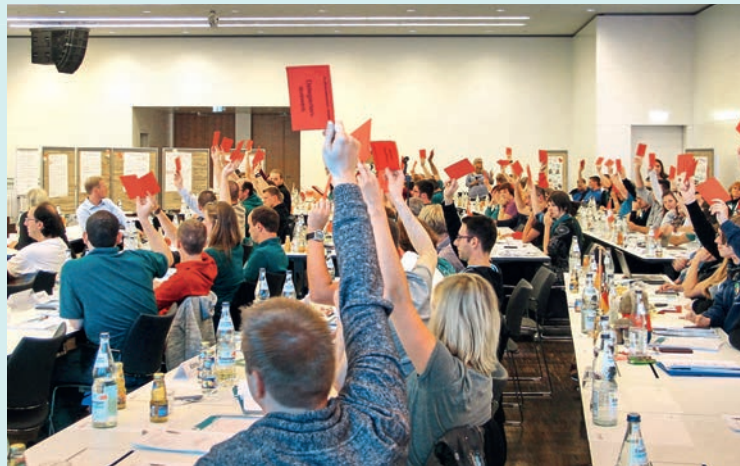
10. JRK-Bundeskonferenz 2015 in Stuttgart: Abstimmung in der Sparkassen- akademie