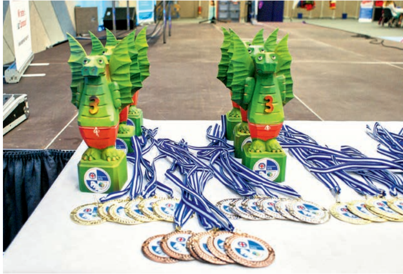
Nur für die Besten: Trophäen und Medaillen lagen beim 14. Bundeswettbewerb im Rettungsschwimmen für JRK-Gruppen in der Wasserwacht 2015 in Schwarzenberg/Aue bereit