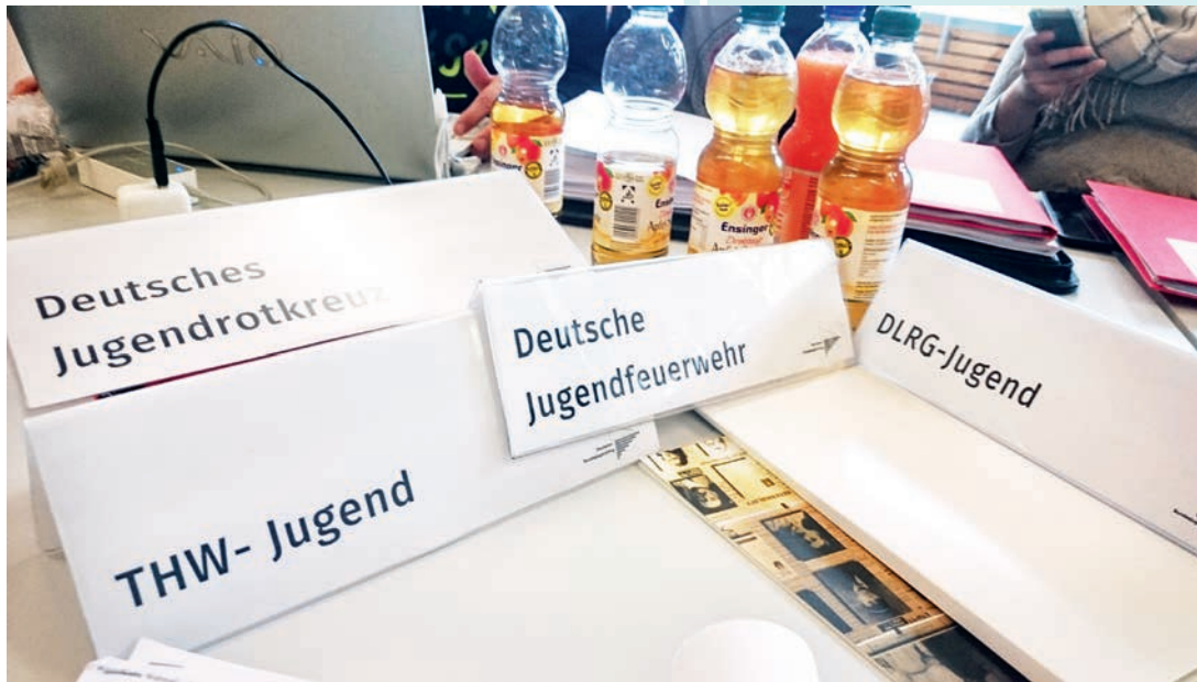
Deutscher Bundesjugendring: wichtige Utensilien bei der 88. Vollversammlung im Oktober 2015 in Heidelberg