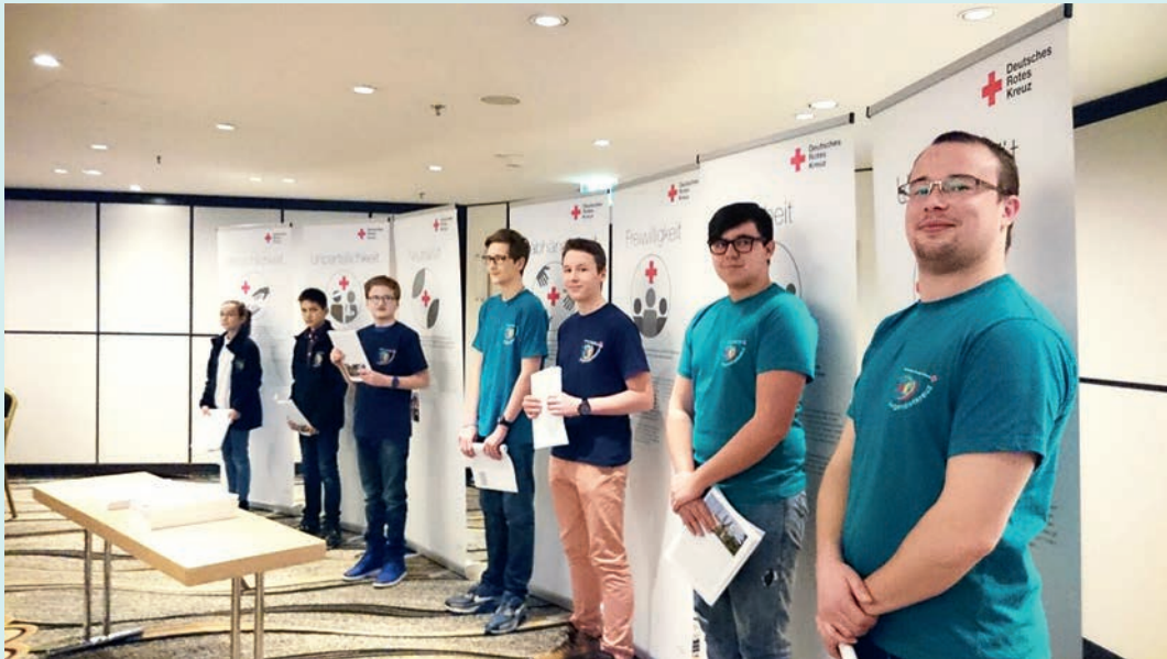
Präsentationsrunde bei der 65. Bundesversammlung des DRK im November 2015 in Düsseldorf