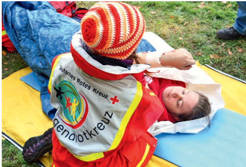
Trockenübung für den Notfall beim 27. JRK-Bundeswettbewerb Stufe I 2015 in Bad Doberan