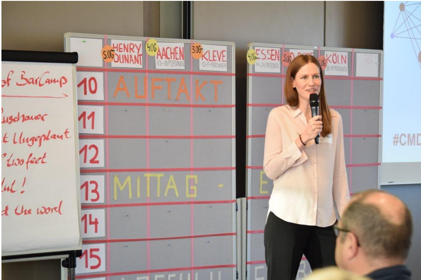
Bar Camp auf dem Cross Media Day 2019