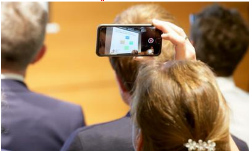
Tom Maelsa / DRK